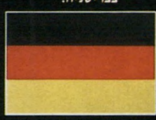
פרס העיצוב הגרמני. מרכז העיצוב של שטוטגרט.