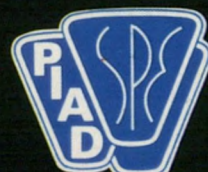
פרס העיצוב החדשני. האגודה האמריקאית של מהנדסי הפלסטיקה.