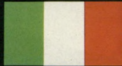
מכונית העילית של איטליה. MOTOR.