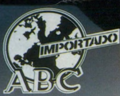
מכונית היבוא של השנה ABC MADRID

פורד סיירה. המכונית שזכתה ב-15 פרסים ובהישג הגדול מכולם – המכונית הנמכרת מסוגה באירופה.