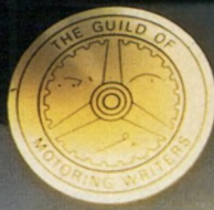
מכונית העילית של 1983. איגוד כתבי הרכב בריטניה.