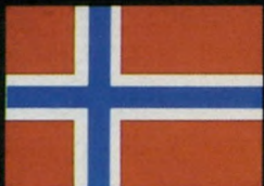
מכונית השנה בנורווגיה.