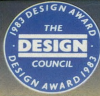
פרס האגודה הבריטית לעיצוב.