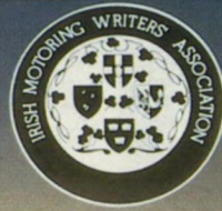
מכונית השנה באירלנד. איגוד כתבי הרכב באירלנד.