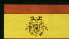
מכונית השנה באירופה. הרדיו הספרדי.