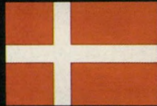
מכונית השנה 1983. איגוד כתבי הרכב בדנמרק.