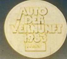
מכונית השנה בגרמניה. MOT MAGAZINE