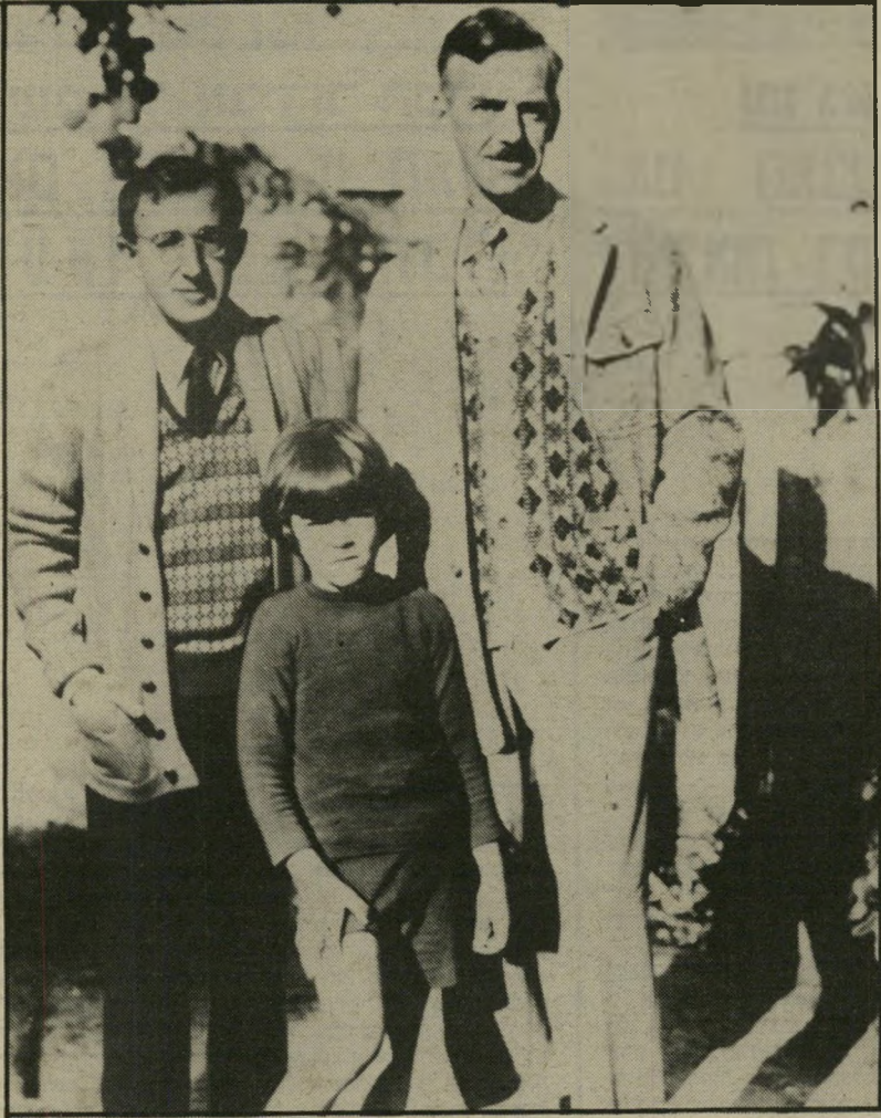
ליאונרד זליג עם הסופר יוג'ין אוניל