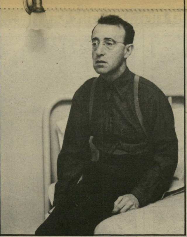
וודי אלן בתפקיד ליאונרד זליג