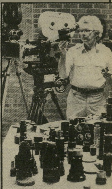
צלם גורדון ויליס בלי עזרת מחשבים

כמו וודי אלן, שעמו הוא מרכה לעבוד, אין הוא חש בנוח בתוך חברת אנשי סרטים שאינם מצטיינים בטעמים המשוכח' לדבריו. המיסוד השיב לו באורח המטבע, ולמרות שמעטים הם הצלמים המגיעים לקרטליו היום, בארצות-הברית, לא זכה אי פעם בפרס האוסקר. אולי משום שמעניקי הפרס חיים עדיין בעולם של אתמול, ואינם יודעים להעריך את השינויים של היום, אומר חברו למיקצוע של ויליס, הצלם האסקל (מ) מנחם מוירביגניה (ולף) וכסלר.