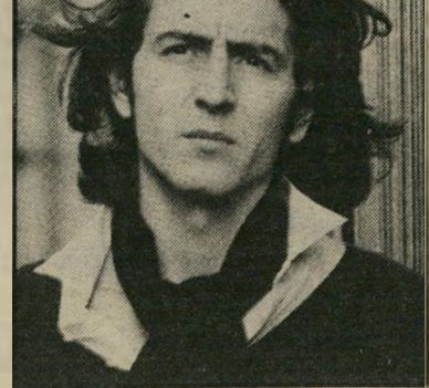
פילוסוף לוי יליד הפאשיזם והסמטאליזם

כפרק זה הוא מעמת את ערכי היהדות (השפויים), ולא אלה של הרבנים בהנא, לווינגר ונושא כליהם הביצועי ה"כ חנן פורת) מול הגאונות האירופית, הוא כוחן את נרפותם של