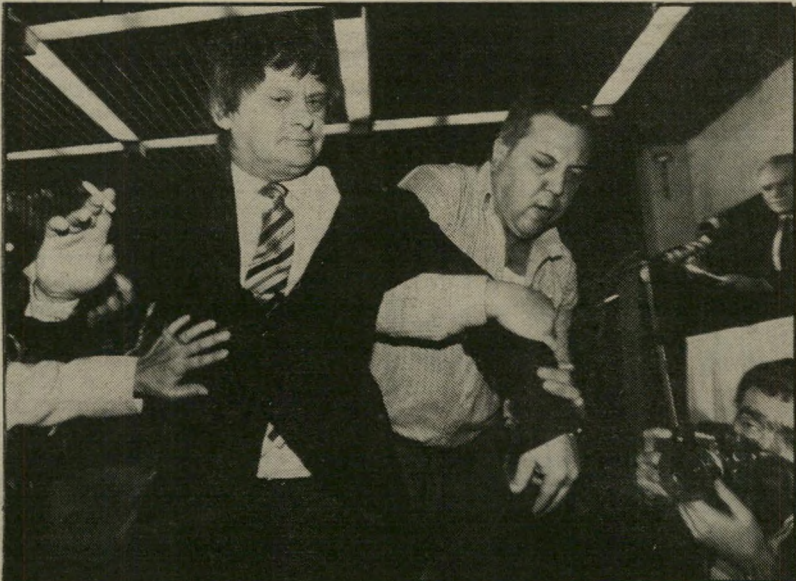
ראש ממשלה שמיר (מימין) ובעל תעלולים קלצ'נסקי (משמאל) ויכוחים דמוקרטיים ומאבקים לגיטימיים

ניתן לפנות לוועדה במרכז התנועה: רח' המלך ג'ורג' 48, תל-אביב. טלפונים: 03-289005.