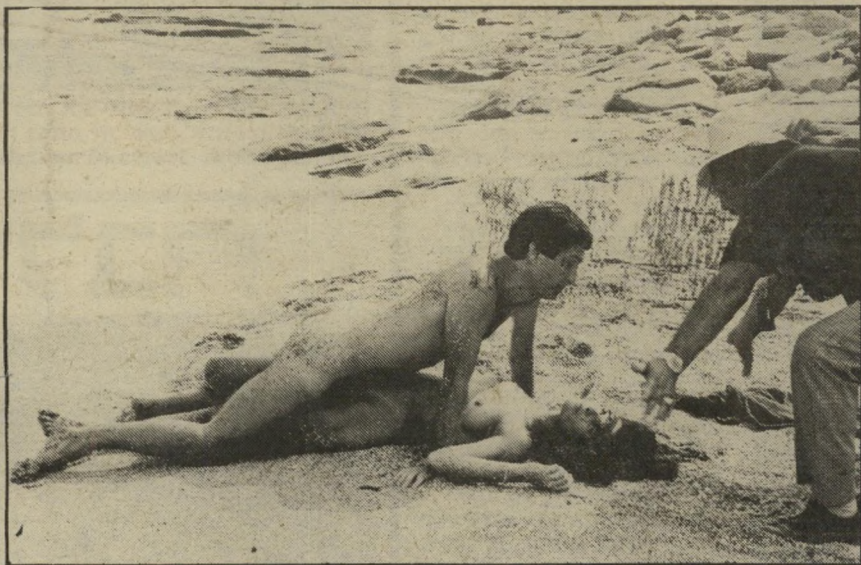
סצינה מהסרט "הרודה מארגנטינה" תוספת עליזה לסרט

לא כל-כך! כשהיה בניריווק, לפני שלושה חודשים, פגש שם את מלי בורנשמיין , הזמרת, שהיא גם עורכת-דין (עובדה, רבותי, זאת