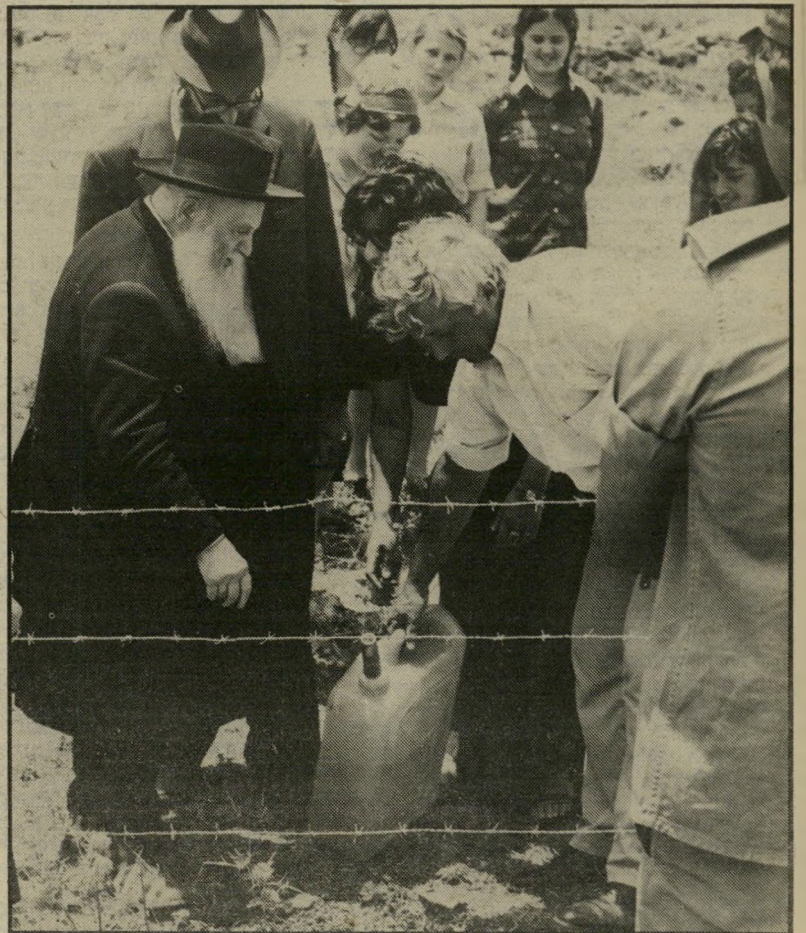
אריאל שרון והרב צבי קוק בהתנחלות האמונה עדיפה על חברית

הרב ח"כ דרוקמן מתגלה מיום ליום כקיצוני שבקיצוניים, כדמות העשויה להוליך את הציבור