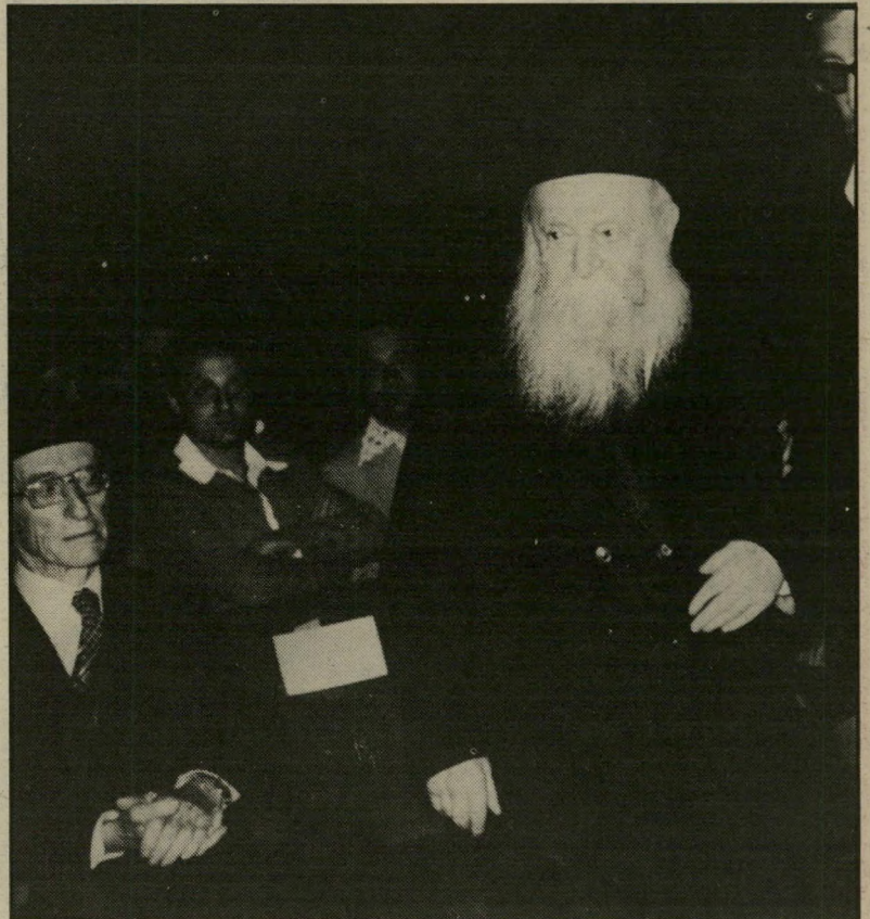
הרב צבייהודה קוק (עם אורי-צבי גרינברג) תלמיד תורן בחדר הסמוך

בשנת 1925 חזר צבי יהודה קוק, ביחד עם אביו, לירושלים, וליווה אותו בכל אשר פנה. הוא סייע לאביו בהקמת ישיבת מרכז הרב.