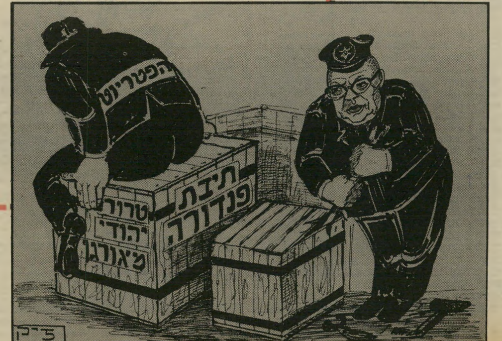
מה עם השניה?

רמון (33), יונה בהשקפותיו הפוליטיות, הוא חבר בוועדת-הכספים. ח"כים רבים בסיעתההמערך סיפרו השבוע להעולם הזה שהוא מצטיין בהתמדה ובחריפות, ושעמדותיו בנושאים שונים נובעות מהשקפת עולם סוציאלי-דמוקרטית ברורה וחדה. מי שמכיר את אנשי המערך, ובעיקר את הח"כים ממיפלגת-העבודה, יבין שמדובר כאן ביוצא מהכלל. המעיד על הכלל. רק 10 מקרב 50 חבריההסיעה היו נחשבים כ-סוציאלי-דמוקרטים