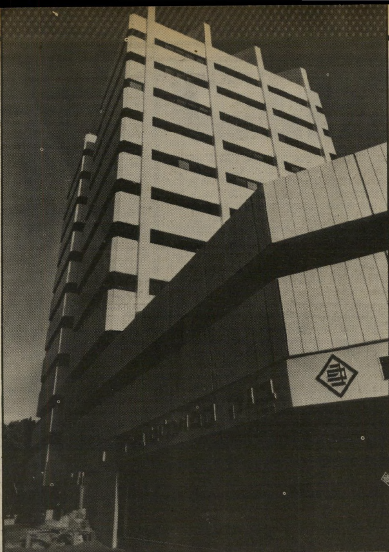
בנין "אמפל" בניין-הפאר שהקימה חברת אמפל, שהיא חברת בת של בנק הפועלים. הבניין הוקם למרכזה הישראלי ברחוב ארלוזורוב 111 בתל-אביב, ובו יש לחברת-האם, בנק הפועלים, סניף-קרקע ממואר לא פחות.

במשך השבוע פורסמו כמה גירסות כחובות, וגם מגוחכות, לגבי פרשה זו. נאמר, למשל, שהעיסקות רוקנו את בנק הפועלים — דבר שטוטי, מאחר שגודל ההעברות, אף שלא היו מבוטלות כלל, הן עדיין קטנות מאוד בהשוואה לניכסי בנק הפועלים, המגיעים למיליארדים רבים.