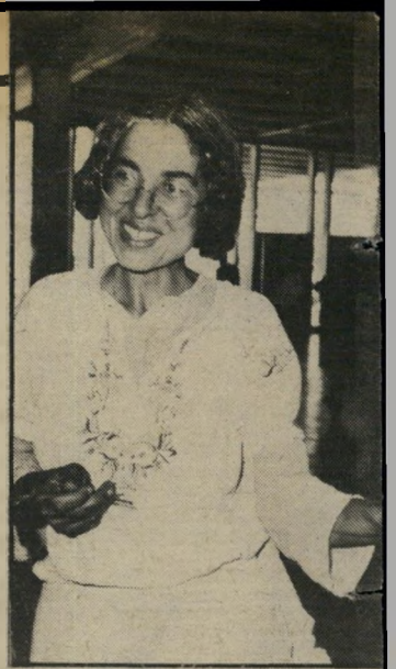
האוניברסאל של פגישת אדם והוויה, וזו חותמת: "So Welcome"

היא קראה לי במישרה את חוות-הדעת המפורטת שהכינה, וביקשה שלא אגרע ממנה אפילו מילה אחת, כדי שמוכנם של הרברים לא ישתבש. כאשר שאלתי אותה אם