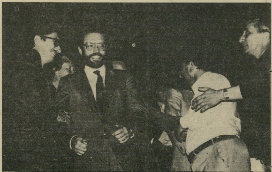
הבימאי קזיסטורף זאנוסי בפסטיבל הסרטים בוונציה איש לא יוצא נקי

העלילה היא בעצם פשוטה מאוד. מדובר כאן בוג פולני צעיר ואידיאליסטי שעומד להינשא. הוא בן של רופא מנתח מפורסם שנישא לאשה צעירה ממנו בשנים רבות. היא בתו של פעיל