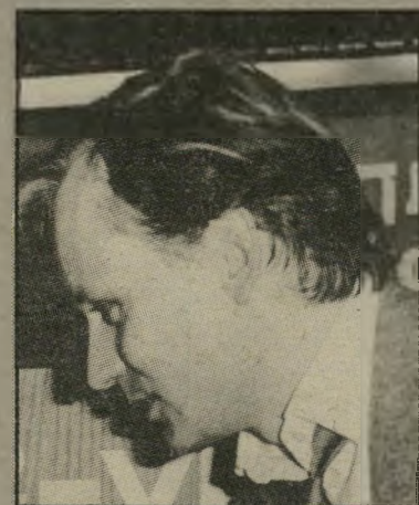
שחקן סטולאן סקארסגארד לא לתקן את המלט

סקארסגארד, שזרוא נשוי ואב לשלושה ילדים הוא חבר קבוע בלהקת התיאטרון הממלכתי של שוודיה. לכאורה זה היה צריך