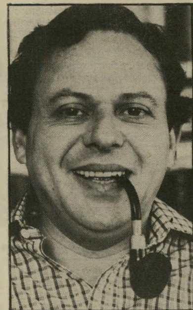
קורא פרי בזמן קציר העומר

כבר היו דברים מעולם, וניחושיו על זהות הזוכה בפרס הו לחס-חוקם של הפרסים החשובים בעולם (למשל, פרס גונקור) — תופעה מבורכת המגבירה את העניין והמתח מסביב לפרס-הזיקרה. אבל אם להיצמד לעובדות: חברי-השופטים עדיין לא התכנסו אפילו פעם אחת. רוב חבריו נמצאים כרגע בחו"ל, ואפילו טרם נבו לעיין ברשימת הפונים או המומלצים. רשימה זו, שעדיין לא נסגרה, כוללת כבר היום חלק ניכר ביותר מן הסופרים החשובים