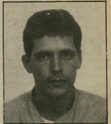
קורא גולן על מצני י"י

הובילו אותו לחקירה, מבלי לדעת מה ההאשמה/ נתנו לו בעיטות, הוסיפו מכות/