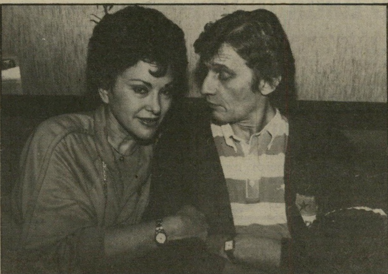
זמרת זראי וחבר לחיים הרדיו פורץ את הסורגים

גם לא מאנשי הסגל האקדמי יש לצפות לתיקווה. גם הם הוכיחו שאינם עוסקים בתורה לשמה, אלא שתורתם היא קרדום לחפור בו. אולי מבין שורות הרתים יצמח פיתרון למצב? קשה להאמין. בייחוד בתקופה שבה רמות מרכזיות בעולם הפוליטיקה הדתית עורכת נשף-כלולות מנקר עיניים ובשרני, כאשר חלק מהעולם סובל מתת-תזונה. הישועה יכולה לבוא מצד אדם נאור ובר-לבב.