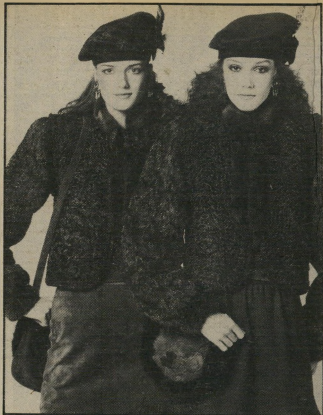
גם בפאריס לא התבייש מעצב־האופנה ז'אן-לואי שרר לעצב מעיל שחלקו פרווה אמיתית ושרווליו צמר מוהר לורקס. הדגם אופנתי ושילוב החומרים גם מוזיל את המלתחה החורפית.