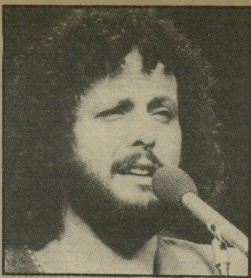
זמר סיני מתוקן

פרשיות כלכליות, שבתקופת הכתבים הכלכליים אברהם ("כוש") קושנר ואלישע שפיגלמן היו בלעדיים לטלוויזיה. חיים פלטנר התנגם על הכישלון בכך