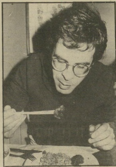
מנחה שלו התרגשות

סקופ אבוד זה של הסקופרים מהרוכנה לכלכלה של הטלוויזיה מצטרף לסקופים אבודים קודמים, כמו פרשת ה"רולאריציה" ושאר