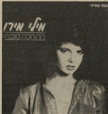
להסכיד/מכל מיני סיבות/השפרידה הזו/לגמרי מיותרת/הרי פשוט זה לא יכול להיות.

מילי מירן — התחלה טובה; הר ארצ'י. כדי לאהוב את התקליט, צריך לאהוב את הקול של מילי מירן. מעבר לקול מוצג עירוב מגוון של סיגנונות, איכות תמלילים ותיחום הפקה מוסיקלית. הגיוון מבין, כי הוא נע בין לא טוב לטוב, הלך וחזר. כותרת הקטע מצוטטת משר הנקרא אנשים אוהבים לשיר, שם ממשיך אנשים אוהבים לשיר/ושרים אוהבים אותנו/נאמץ תו אל תו/ונשיר ונאהב... כוא נצא אל הכרם כליל כוכבים/נשתכר מן האור והיין/ניצמד ונהיה כאשכול ענבים/כי אצלנו השיר חי עדיין. לצד מתיקות ישראלית-בנאנאלית — תמימה זו שרה מילי מירן שיר האומר... רק אתה יודע/מה אני אוהבת/אין טעם