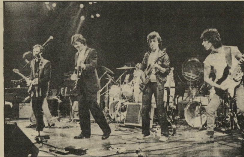
קלפטון וחבריו* בביצוע, ליליה סיכום נכבד להקלת הסבל

למרות שהוא חוזר בהתלהבות על כל מילה. במבט לאחור, אין ספק כי אריאל הוא המתאים ביותר לתואר "זמר השנה 1983". הרי רוב נושאי שיריו האחרונים, דוגמת טרף קל ואנו המיואשים, מתארים באופן המוצלח והישיר ביותר את כל שקורה במדינת-ישראל בחודשים האחרונים.