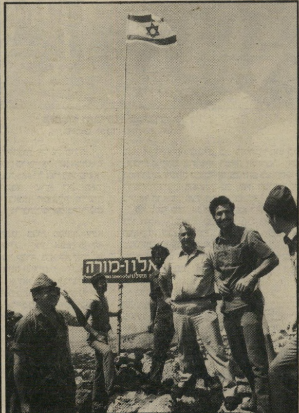
מסגנים בפסטיבל של גוש'אמונים