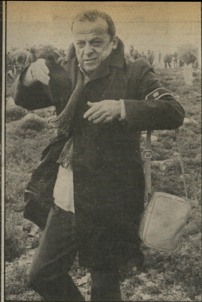
ממנהיגי הגוש בדציון