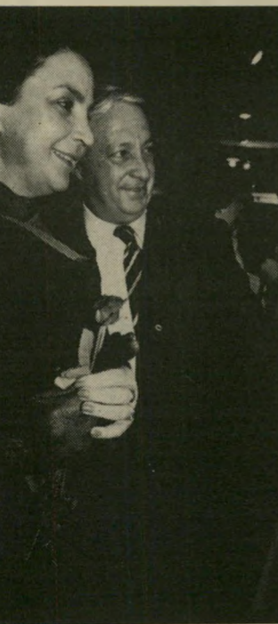
אריאל ולילי שרון שפה משותפת

המתנה המתוחק עתה הוא של שר הביטחון, משה ארנס. התומך המרכזי שלו, גאל כהן-אורג, והפך שר בכיר בממשלה, ועד שלא יתגלגל ממדרגות