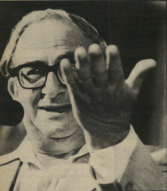
נואם נבון (1984) אין מה לעשות

אמת, לא כוון נגד ממשלת יצחק שמיר. היעד היה אך ורק להרתיע את יצחק נבון. שליחי פרס אמרו למקורביו של נבון שהוא יירשם כמכשיל המהלך ההיסטורי להדחת הליכוד מהשלטון. הלחץ על אנשי נבון היה עצום. כמה מהם נקראו לשיחות עם פרס עצמו, וקיבלו "דיווח" על השיחות עם גורמים בקואליציה, העומדים לערוק בכל רגע, ולהקים ממשלה בהנהגת המעמד.