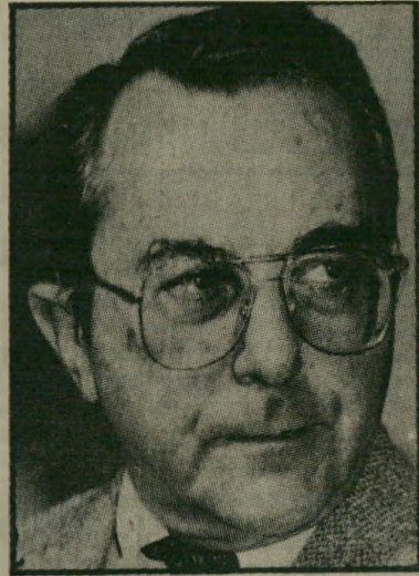
משה ארנס טינה לאורך שנים

האימרה. מים שקטים חודרים עמוק. ההתרשמות ממנו אומרת שזה אדם שקט שאינו מסוגל להתרגש ולהתרגז, אולם אם מקלפים את הקליפה החיצונית הנוקשה, מוצאים אדם שנוטה לבעול בקלות. בעל יצר מילחמתי ונטיה למריבות. היכולת להגיע להתלהבות עצומה גם היא מוסתרת