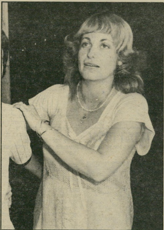
תובעת נקדימון פגישה בדיאנון

בפרקליטות ייחסו חומרה רבה לנסיונו של ארנון דגני לסיים את המישפט באופן פרטיני. מאז נקשת סניגוריו של השר אהרון אברחצירא לפסול את השופטת ויקטוריה אוסטרובסקיכהן בגלל המילים