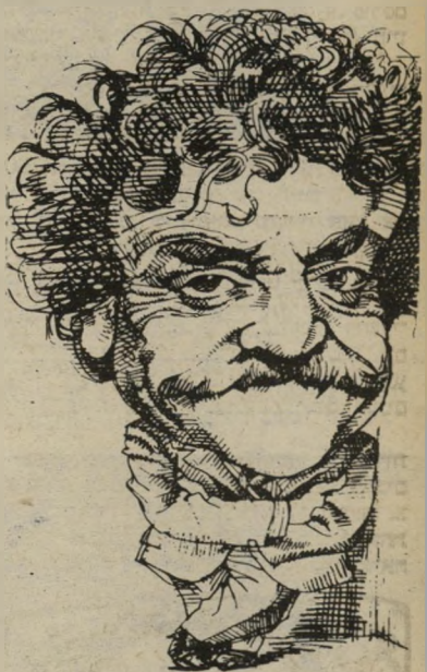
סופר וונגוט לא בין חיפה לבירות

אין ספק שספריו של קורט וונגוט נחשבים מיטב הספרות הצינית העולמית. אחרי בית מיטבחיים חמש, אמה לילה, יברך אותך אלוחים אדון רוזוטר, ציפור כלא, ארוחת-