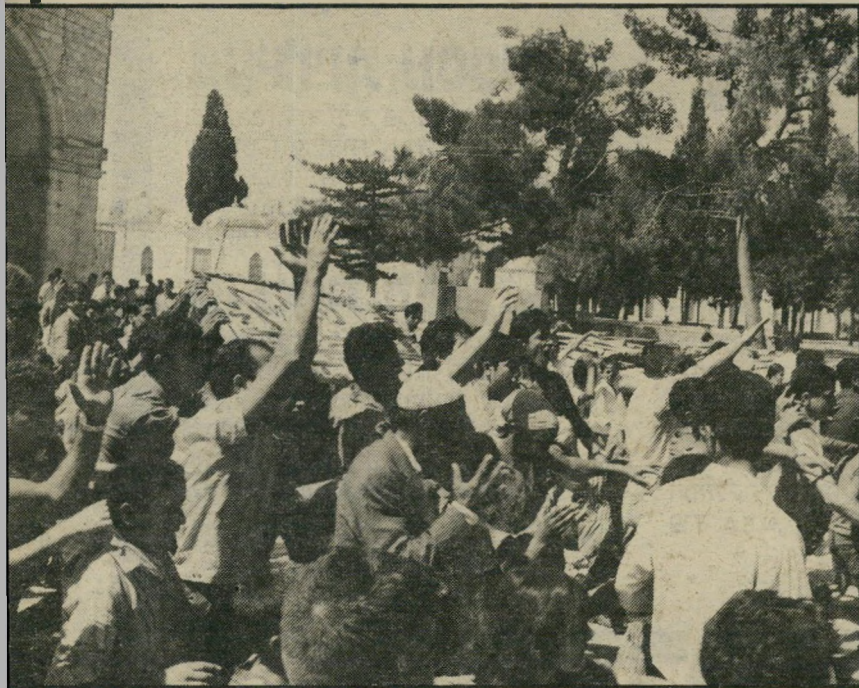
הפגנה מוסלמית ליד מיסגד אלי-אקבה אחרי ההצתה של ריהאן (1969) להפוך את עולם האיסלאם ללבה רותחת...

במיסגרת זו החל כמאבק נגד מדיניותו הרירלאומית של ראש-העירייה טדי קולק, מאבק שאילו צירף את הרצון להשיב את "כויות