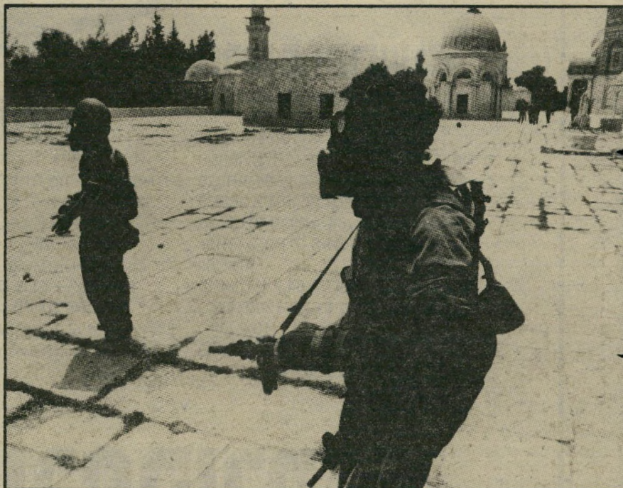
אנשי מישטרה-הגבול ליד כיפת הסלע אחרי השתוללות-הרצח של גרדמן (1982). בפעם הבאה יהיה זה מיטען אמיתי!

קשריהם עם גופים אמריקאיים קיצוניים ואמונתם הדתית, הגובלת בחומייניזם יהודי, הופכים אותם לאחד מוועייה-הפורענות המסוכנים ביותר של הניאופאשיזם הישראלי.