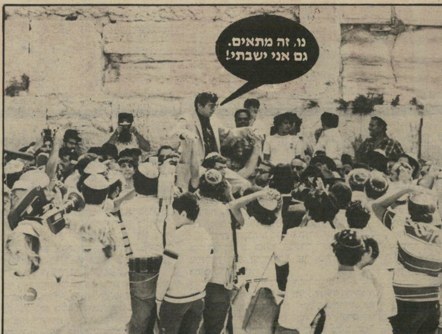
אבו-חצירא נישא על כתפי מעריצים ליד הכותל המערבי

מוקדם להחליט. ● עורך-הדין אורי הופ-רטי: "ישראל מתש"ח לתש"ד" — מיוזמטארט (מדינת יהודים) ליוזמטארט (מועצת יהודים)." ● ח"כ מופ"ם, אימרי רון: "אני מרגיש מולדת ביהודה ושומרון. זו לא אדמת ניכר עבורי. שאגיד שהמקום שבו התקיימו הקרבות של יהודה