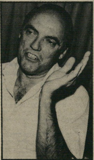
לואיס בנאום נלהב

הדיבורים על הבוררות שיגרום ליהודי אמריקה או אירופה לעלות לישראל מעוררים חיוך של רחמים במחלקת-העלייה. שרון הוא האיש האחרון שיעלה יהודים. עצם נוכחותו מהווה גורם מרתיע עבור רובדובים.