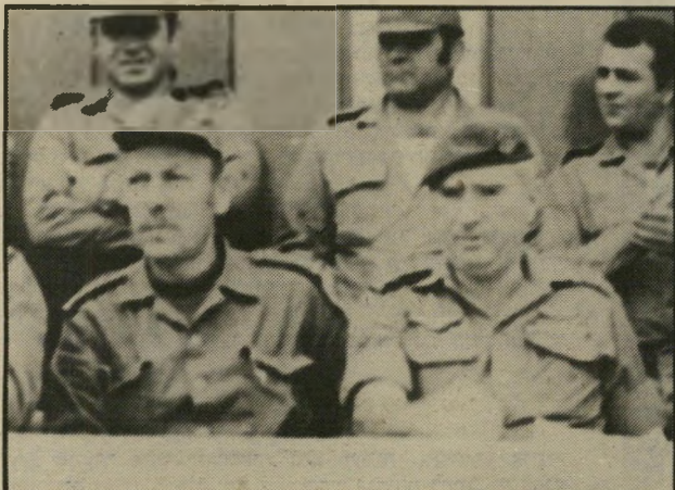
בחברת רפאל איתן הסורים הם מקור כל הצרות.

כאשר עלה בפעם הראשונה על פני השטח, היה נרמה שהתשובה פשוטה למדי: הוא קוויזלינג. ישראלים רבים לא התקשו לקבוע זאת, בייחוד אחרי שקראו את יומני שרת. בזמנים אלה רשום ויכוח, שהתנהל בחשאי בצמרת המדינה בשנת 1955.