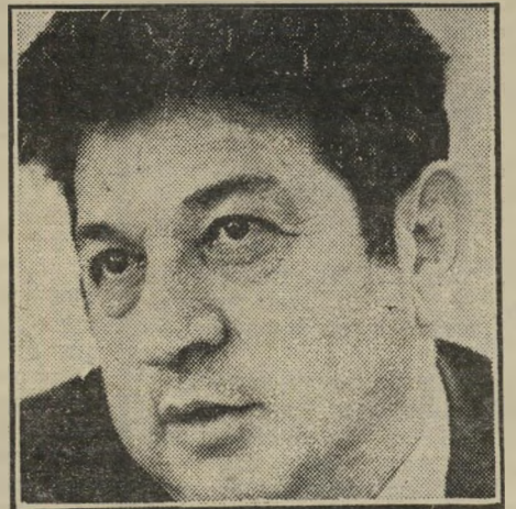
גזית יושב־ראש הנהלת בנק הפועלים, שדרש לברר את הפרשה, מח"שש לפגיעה בבנק שבראשו הוא עומד.

● ב־18 בדצמבר 1978 מכר בנק הפועלים חלק מבנק הפועלים קיימאן לאמפ"ל תמורת 180 אלף דולר. כעבור שבועיים (ב־31 בדצמבר 1978, תאריך המאזן של אמפ"ל) הופיע ערך הרכישה אצל אמפ"ל ב־380 אלף דולר! איך אומר המושגמון שניסח את הדוח: "יש כאן מתנה ללא תמורה לבעלי המניות הזרים של אמפ"ל".