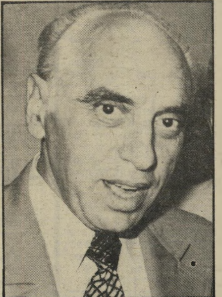
רוטמן מנכ"ל סולל-בונה ואחד משני החברים בוועדת-החקירה ה־חשאית החוקרת כעת את פרשת לוינסון.