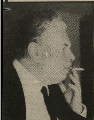
תובע שראטר עוד כמה ימים