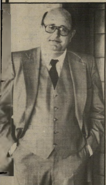
סניגור קרר השופט הסכים