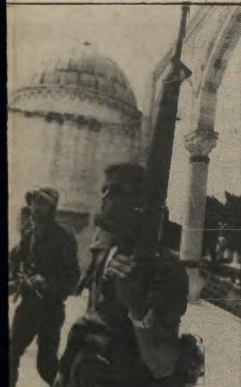
חייל בהריהבת החשמונאים נגד כיפת-הסלע.

מסויים הינו אירגון טירוריסטי... תשמש כהוכחה ככל דיון מישפטי. לחוק זה נעשה תיקון, שעליו חתום ראש-הממשלה לשעבר מנחם בגין. התיקון מטיל עונש של שלוש שנות-מאסר, לכל מי שמביע בעליפה, בכתב או במעשה, תמיכה ועידוד כאלמות ובאיומי-אלימות, או מגלה הודעות או אהדה לאירגון טירוריסטי. חוק זה תקף גם לגבי המחחרות הימניות הפועלות כיום בישראל, מחתרות, שממשלת-ישראל מונעת עצמה מלהכריז עליהן כעל אירגונים טירוריסטיים, וזאת למרות המלצות השב"כ, המישטרה, ונאומיו האחרונים של הרמטכ"ל הנוכחי — המעידים כאלף עדים על קיומן.