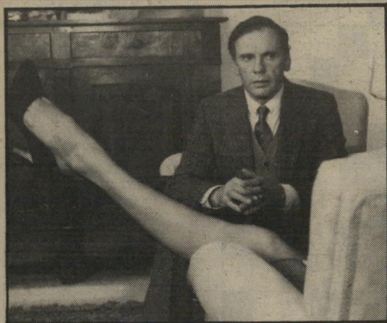
ז'אן לואי טריניטיאן: בשוֹבבות ובעליצות