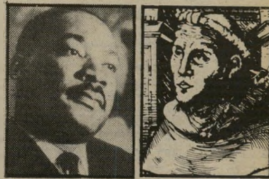
קינג לותר זיכרון היסטורי קצר

(עם הנרי פונדה) הסרט הישן שהוקרן בטלוויזיה לפני שבועיים, לא הוסיף להשכלתם של הצופים. להגייבור ציטט את מחולל הפרומציה, מרטין לותר, הקפיד המתרגם להסביר לצופים כי בעל האימרה הוא מרטין לותר קינג. זה לא קרה פעם אחת, אלא שלוש פעמים במהלך הסרט. הזיכרון ההיסטורי של העובדים בטלוויזיה