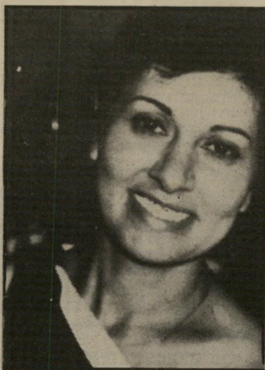
קוראה ארליכוב-גורלי עוד עדים

(העולם הזה" 21.12.83) מתקנת פרט: כתבתם כי הייתי ערת-מדינה נגד אשר ידלון,