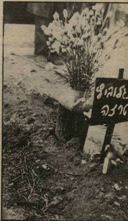
קבר המריבה להרוס את הבסטיילה

ההתנכלות הרבנית לקיברה של המנוחה תרזה אנגלוביץ דירבנה את