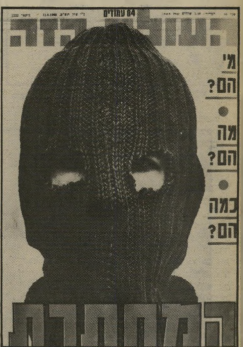
שער "העולם הזה" 11.6.80 מיומנות צבאית

שבאופן מילכוד הרימונים. חוקרי מיטרה משערים, לעומת זאת, שהפעם מדובר בחיילים בשירות-סדיר, בעלי גישה נוחה למיצבורי רימונים מדרג 26 המקובל בצה"ל, דגם הרימון שקטל את אמיל גרינצוויג. החוקרים מניחים כי מדובר בשאריות מסדרות רימונים, שהשתמשו בהם במלחמת-לבנון, וקשה לאתר את המשתמשים בהם. לדעת חוקרי המיטרה, אכן מדובר במחלת יהודית קיצונית, בעלת רקע צבאי רב וידע מעולה בחבלה. כמו כן, לדעת המיטרה, מונעת הקבוצה על-ידי אידיאולוגיה ברורה וקיצונית, והראייה, שאנשיה לא בחלו למלכד