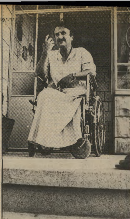
ראשיעיר שבעה אחרי הפיגוע

הסירור היהודי, המאפינת את כל הגופים הטוריסטיים הפועלים כיום בשטחים, זו האידאולוגיה הלאומנית, הקובעת שיש לטור את כל ארץ ישראל מתושביה הורים, ולהקים בבוא היום מיקרש שלישי. אחת המטרות העיקריות של המחותר היהודיות, היא הרהיבת.