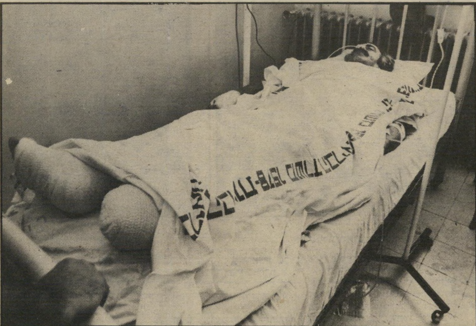
ראשיעירייה חילף אחרי הפיגוע המחבלים לא נתפסו