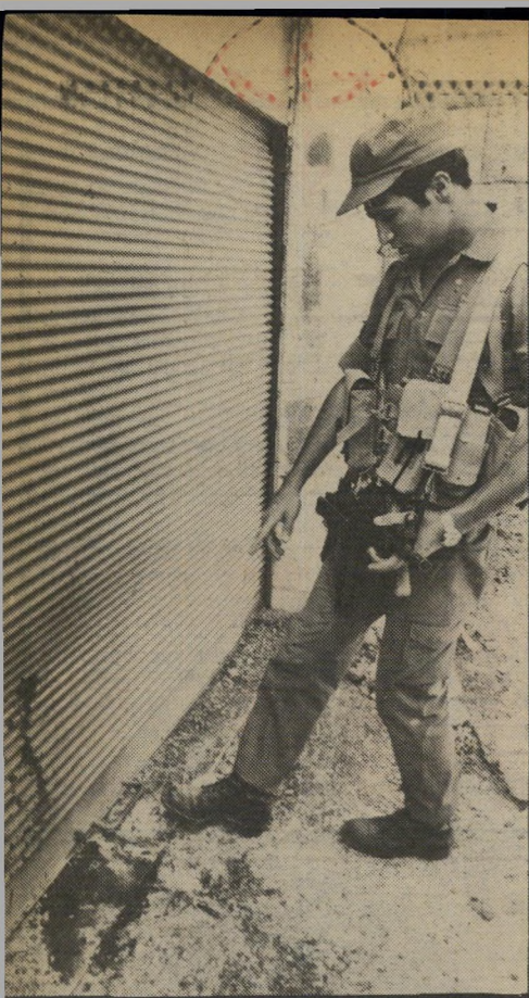
הפיצוץ לפני המוסך של ראשיעיר טוויל שני סוגי מחתרות