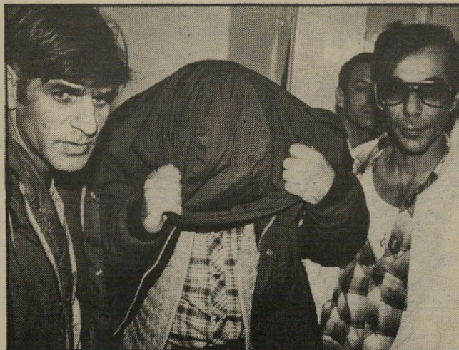
השוד הרנינו (מסתיר פניו) ושוטרים כוסית-ה נשק

בבית-החולים וולפסון, שבר הריטים וציוד, וכאשר אושפו לצורך הסתכלות, נמצא כי בשעת ההשתוללות לא היה אחראי למעשיו ולא ידע להבחין בין טוב ורע.