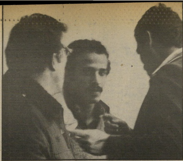
השוד מחראווי ברחה והחלטת

הדבר בא כמעט במיקרה. ומכיוון שהמיקרה ממלא תפקיד חשוב בכל חקירה של פשע, מוכרח היה הדבר לקרות במקום או במאחר.