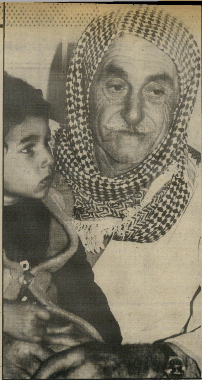
אביו ואחיו של מאהר אמרו לו שהרסו את הבית.

התשובה להשגות אלה תינתן כבר בימים הראשונים של הופעת חדשות. אז גם ייגזר דינו לשבת או לחסד.