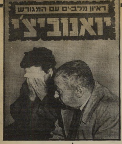
העולם הזה 1109. תאריך: 31.12.1958