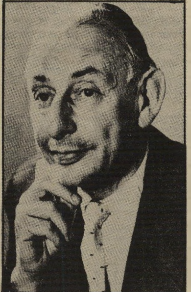
חוקר-קבלה שלום משבר המודרנה

הקודר העיוני של פרופסור שלום, בצד יהדותו החילונית של המלומד. שביד בוחן את השקפתו של שלום, הבוחנת את הקבלה והמיסטיקה היהודית מעד לאותה הרגשת מרחק אינסופי בין היקום הגשמי, והאדם כחלק ממנו, ובין האלוהות, אף על פי שמצד שני, האלוהות היא המקור לכל היש... שביד סוקר את בחינותיו של שלום לעמדות הניכור היהודי, בצד המהלכים שמיסדו את הדת היהודית, ואת היות המיסטיקה העיונית (ולא השימושית) אחד ממקורות החיות והחינוניות של היהודים במשך דורות רבים (חינויות, שרומה כמו אכדה בתהומי הבורות והשטיות הישראלים). בעיונו קובע שביד, בעיקבות שלום, שהיהדות