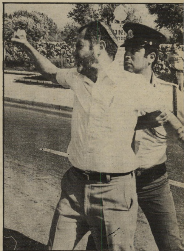
כהנא נעצר ליד הכנסת נירנברג בנצרת עילית

את עמדת פרקליטות-המדינה סיכס עורך-הדין יאראק במילים: "הבאנו דברים מחרידים אלה, שהיד רועדת לכתבם, רק כדי להמחיש מהי המשמעות הנוראה בהשמעתם במדינת-ישראל. הייפלא כי בתי-הספר מפרכים לתת לאדם כעותר דריסת רגל בין כותליהם?"