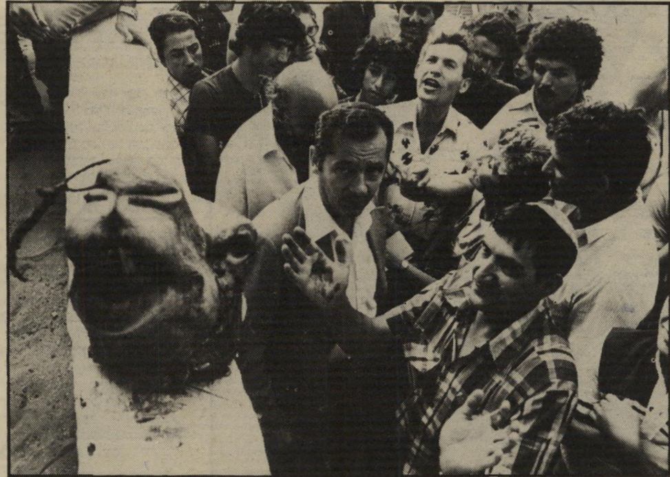
דיין וכהנא מניחים ראש כרות של גמל לפני מערכת "העולם הזה" מי שמותח ביקורת על המנהיג, מודח

במקביל לעלייתו השניה ארצה יסס הרב כהנא בארצות-הברית את ורו לעולם לא עוד! שכותרתו היא סימטת "הליגה להגנה יהודית." זה, שהוא מעין גרסה יהודית של ון קאמפף מאת אדולף היטלר, גן כהנא שצפוייה השמדה נוספת