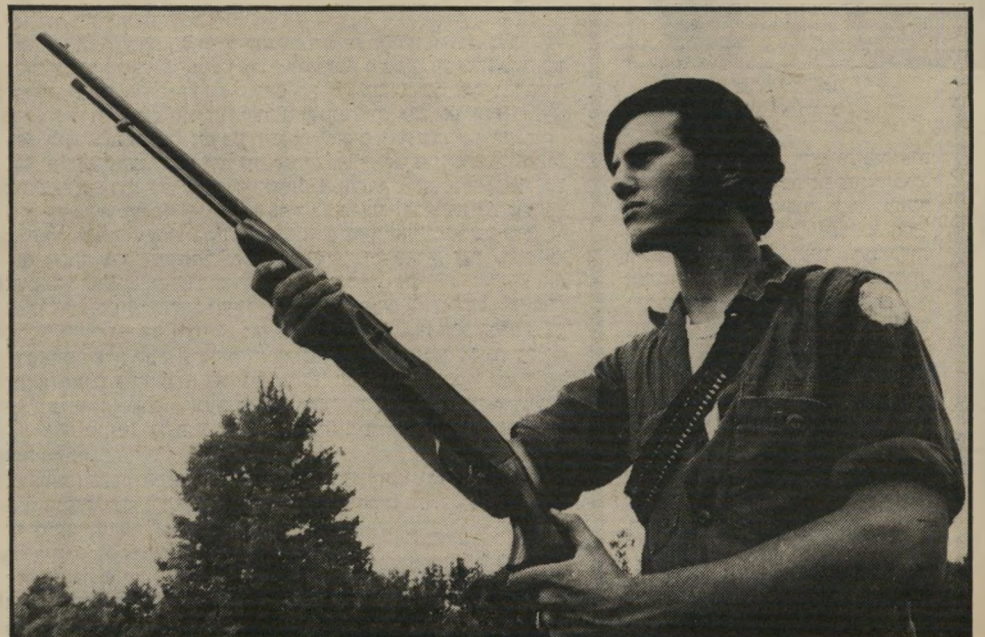
תמונת-פירסומת של הליגה להגנה יהודית בארצות-הברית קרע על רקע מיסותרוי