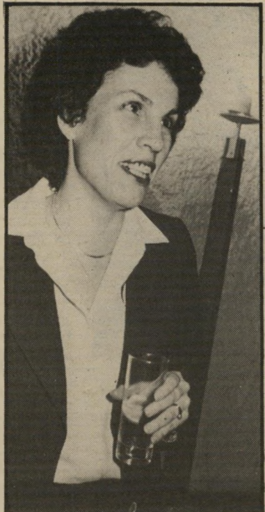
מפקחת מאור היא תעזור, בתוקף התפקיד

ושוב בנקים. הגיע אליי עוד אחד מהחוסכים אמנים בתוכנית-החסוד הממשלתית שבי נוע הבנקים. ועכשיו בדיוק מתחיל הסיפור: "להפסיד פעמיים ועוד פעם. לאותו חוסך יש חשבון עו"ש באותו הבנק. ולמי שיש חשבון עו"ש, יש גם אוברדראפט. שחלק ממנו החל עוד פטמבר לפני שש שנים, כאשר החוסך החל סוך וחוייב אוטומטית בסכום-החיסוד. בדיוק כשפטמבר השנה הגיעה תוכנית ה-זכון לפירוקה, ואז הורה החוסך לבנק לפרות