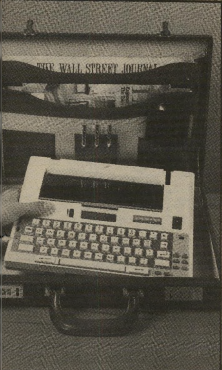
מכונת-כתיבה על סוללות קודם מכניסים, אחר-כך שולפים

מהו לרעתכם האינטרס של בנק שמניותיו נאות בהסדר, מה הוא צריך לעשות — לעודד וחותיו למכור אותן? נראה כאילו כל הבנקים שלמניותיהם ערבה משלה, והיא גם שקונה באמצעות בנקי-ישראל יפות-הגמל את 600 מיליון הדולארים שכבר ברו, יצאו מגידרם, כדי שבעלי המניות ימשיכו חזיק בהם. כך לפחות מתרשם. האיש ירוחב. ובכן, יש לי בשורה בשבילכם: לבנקים בבנקים, יש אינטרס עיסקי בעלי מניותיהם שבהסדר ימכרו את מניותיהם — בדרך זו או אחרת. קודם כל, בעלי האוברדראפט יכסו אותו. דבר נג, מניות בבנקאיות זה כסף "מת". מורה למניות היום הוא כסף "חי", זה הממשיים כל הבנקים. כסף "חי" עוור לבנקים בעיקר לקראת סוף גנה. ואתם תראו שההיצעים של מניות אלה ילו ככל שמתקרב התאריך הקובע: 30 צמבר. עכשיו כדאי לשאלו אם כדאי להחזיק מניות האלה. יש לי תשובה חכמה: מי שמכר את מניות הבנקאיות שלו בימי המיסוד הראשונים ורי סגירת הבורסה, השקיע את התמורה מודי דולר וחזר וקנה בכסום שכירו היום מניות קאיות — יש בידו היום כמות של 15% יותר יות בנקאיות מהשיו לו בעת המפולת. יש לכם זמן להחליט. למי שעוד לא החליט. יש מזה אני לא יודע מה יקרה בעוד שבוע, או גה ל להיות בטוח כמה שיקרה בעוד ארבע או ש שנים?