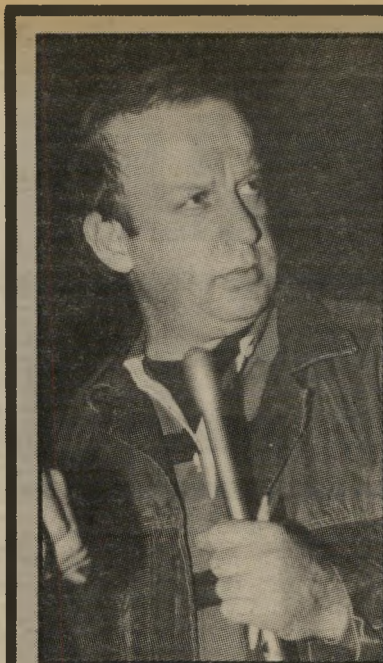
כתב אורן מי יסקר מה?

בעיתונות מוזכר סיכוך-העבודה שבין הגננים-מבצעים ובין רשות-השדור באותיות קטנות. צופים חדיעין הבחינו, מן הסתם, שבתוכניות כמו עשה טובה, מה שבא וזה הזמן מופיעים, באחרונה, זמרים ללא גננים מלווים. באחת מתוכניות הדת גויסה תיאמורת