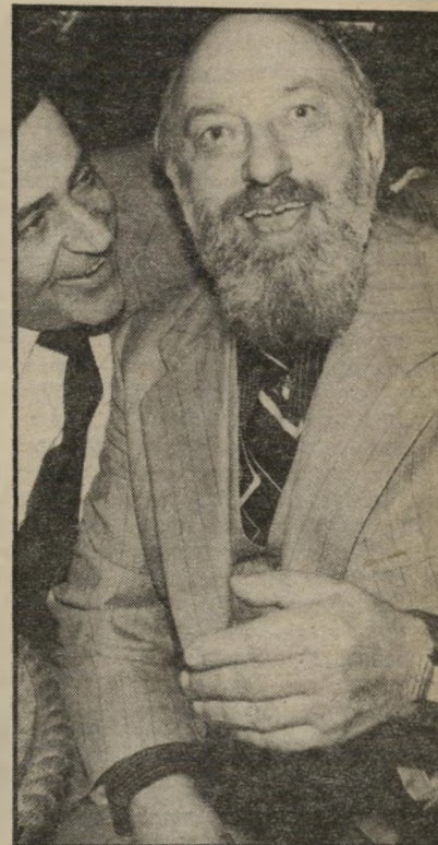
עסקייהרתי בסוק גטו יהודי מול לבנטיניות

● לעורך, מפיץ ומגיש כולבוטק, רפי גינת, על התוכנית המיוחדת שהוקדשה לתאונות-חשמל, תוכנית זו הביאה קשת רחבה של תאונות, שמקורן בחוסר חוש ציבורי