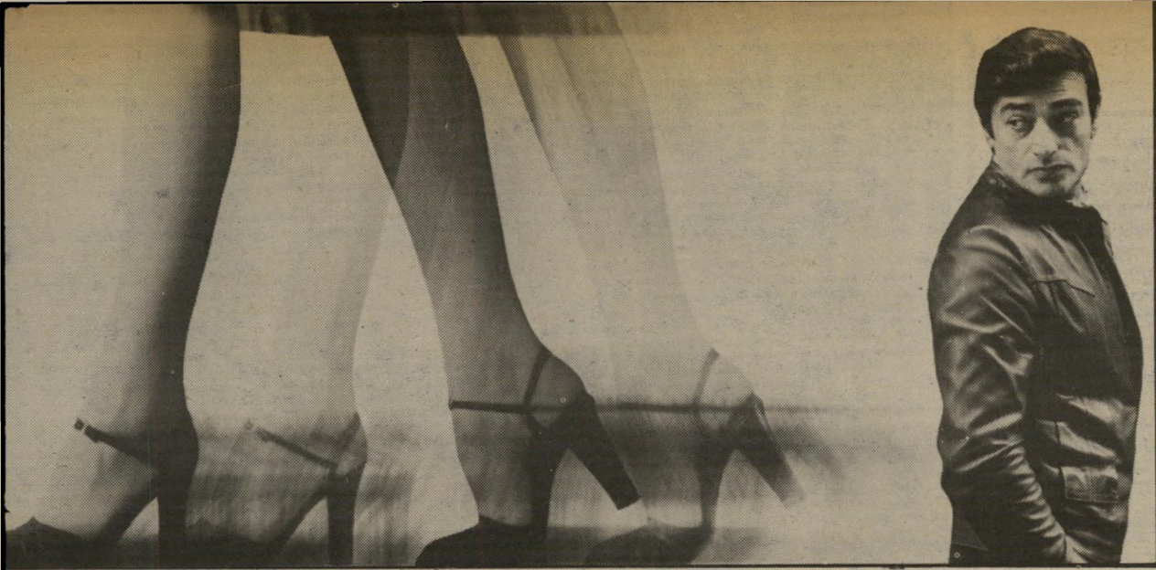
שארלנר בסרטו של פרנסואה טריפו „האיש שאהב נשים” להציץ ברגליים מן המרתף

המתנה היפה ביותר. האשה ממול הפך את פאני ארדן כוכבת וכריזמטית, גם בת זוגו