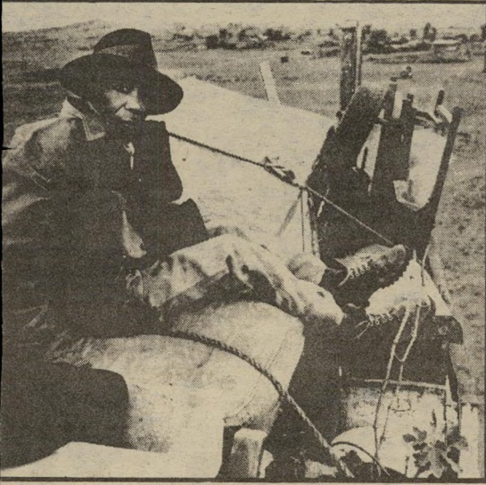
תושב מוגופה יוצא לגלות... אין צורך בתאיגאזים

החזית הדמוקרטית המאוחדת, המלכת 500 אירגוני שחורים, הנהיגה באומץ את המאבק בשילטונות. הם פנו לאירגוני השחורים בארצות־הברית, ואלה כפו על ממשלת רונאלד רגן לקרוא לשגריר דרום־אפריקה בווינגטון, בראנד פורי, ולהגיש לו מחאה חריפה. ממשלת האפרטהייד הביעה „צעד“ על התערבות ווינגטון בענייני הפנימיים.