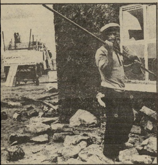
תושב מוגופה מפרק חלונות ביתו אם ירעבו למוות...

נגר הקבוצה, וקוראת למועדוני־הילה בעיר לאסוד על הברחנים להשמיע אותם. עיתוני אנגליה מעירים, שאין כל סיכוי שהחלטה כזאת תבוצע. אם אבות העיר רוצים שקבוצתם תנצח, אין להם אלא להזרים את מאות אלפי הילרות שטרלינג הדרושות לשיקום הקבוצה. כיום וולוורמפטון איננה מסוגלת למצוא את סכומי העתק האלה, ויש להניח שהתכונות, וגם הברחיות, יימשכו.