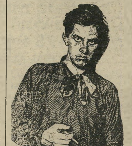
משורר מאיאקובסקי דרך טונדרות פרצנו