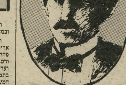
סופר קריין בחינת החיים והמוות

וכאשר הקרב הופך למנוסה: בתוהו-בוהו זה פקדה מחשבה אחת את הצעיר. המיפלט רב-השנים, שאילצה את החיילים האחרים לברוח, עדיין לא הופיעה... והלאה, מצטרף הגיבור לאקסטוז הקרב: טבול בעשן רובים רבים כיוון את זעמו לאו דווקא נגד האנשים הרצים לקראתו, אלא נגד מוסלצות-הקרב המרחפות והזנקות איתו, תחובות את