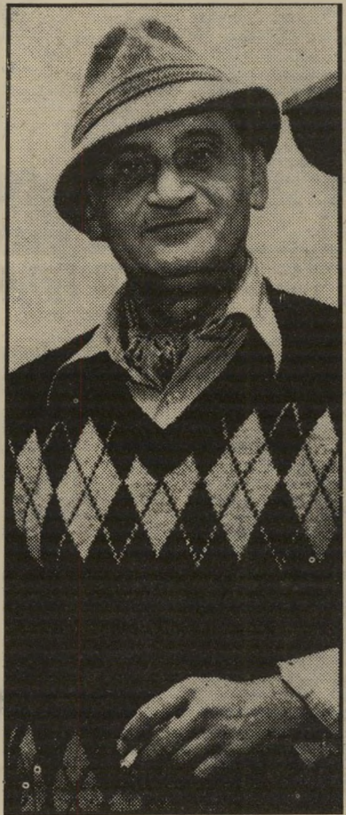
מחבר-פולקלור שחר מיץ-פטל דביק

המתמדת של נוסח הכתיבה השחרי ותיאוריו, לרגלי הספרות הצרפתית והנוסח הפרוסטי שלה. נינגל הוא ספר של קלישאות ספרותיות, הכתוב בידי מחבר שמרן — שמרן בסיגנונו, שמרן בצורת הכתיבה ובראיית-העולם, שמרן משעמם ולא ניאוקלסיציסט. אין ספק ששוחרי הספרות הישראלית, שהתרשמו לפני שנתיים