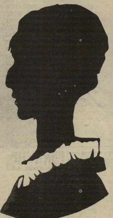
משוררת אחמטובה מת המלך אפור-המבט

שירת רוסיה היא אנתולוגיה של כל שהשפיע על השירה הישראלית, בשלב של דור אחרון לשיעבוד וראשון לגאולה. פואמה כשנים עשר לאלכסנדר בלוק (תריסר בעברית של היום), המשווה את מנהיגי המהפכה-הרוסית לשליחי של ישוע הנוצרי (חבר, רובח אחוז! אל חוס! / כבוד המוות ניר ברום! / במסורבלת, / במדובללת, / ברחבת-האחוריים, / את, את, ללא צלב...), ובפואמה סקיתים (אתם — מיליונים, אנו — תהום, ותהום, ותהום...), היא