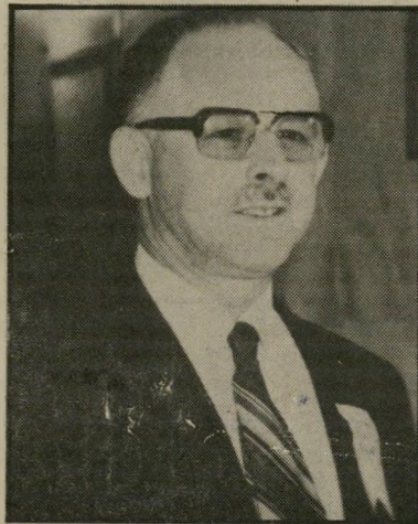
קורא בן-שחר אחדות-לאומית

מסתבר, כי בהילולה של השתתפו כל הסיעות, ומהבחינה הזו היתה כאן אחדות לאומית,