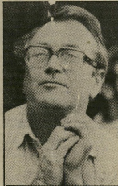
קורא קלרק'יין חמישה רומנים

חמישה ספרים מחפשים קורא. כתבתי חמישה רומנים שאינם מגיעים