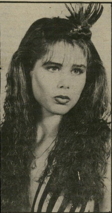
דוגמנית צחור גם לי היה עניין עם שופטים

שהתאכזבתי קשות. אפילו הפסדתי 1000 דולר בהימור. כי הייתי בטוח שתזכי. את יודעת, בחיים צריך מזל וגם קשרים מאחורי הקלעים. אבל אני מציע לך לא לבכות אלא לכווס על מה שהיה, אלא להסתכל קדימה לעתיד.