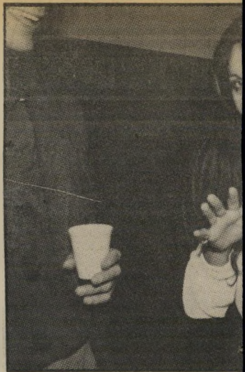
בת החדשות והאשה היחידה בתל- העוסקת בחדשות, כרגילה מנשה. בת דיווחיה על עיצומי עובדי הנמלים.