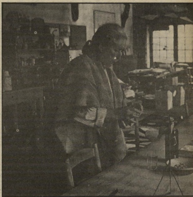
האלמנה בטחנת־הקמח: מעדנים בוויסקי

ההודים רצו לקבל את מלכת אנגליה כמו שצריך, והכינו אפיריון שהוא תעתיק מדוייק של האפיריונים המלכותיים שנשאו שליטים במאה ה־13. הכל היה יפה וטוב פרט לרבר אחד. שכחו שבמקור העתיק לא היה כיסא ואף לא כורסה. כך צעדה לה אליזבת השנייה, נכרתה של ויקטוריה שהיתה קיסרית הודו, ושמרה על חיוך.