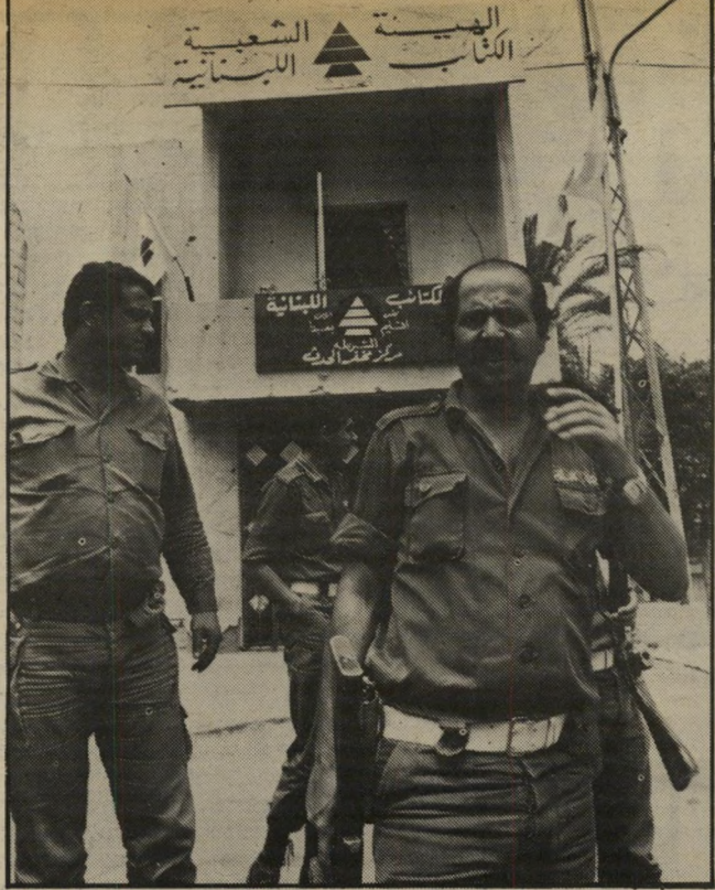
סמל הפלאנגות בבניין של מפקדה מקומית טבח בבירכת-שחיה

הוגים ופצועים משני הצדדים. השליטנות העלימו עין מכל זה, ובכל רגע ציפו הכל להתפוצצות כללית... קרבות אלה, לפני יותר מ-140 שנה, היוו את הפתיח למילחמת החמולות הלכנונית, כאשר שמות המישפחה ג'ונבלאט, שיהאב, שמעון, פראנג'יה, כראמה ואחרים חוזרים ועולים בה.