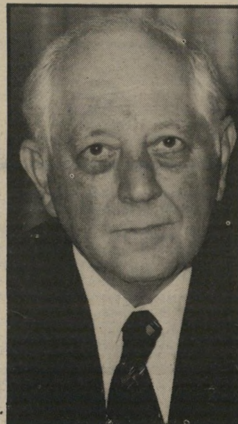
השופט קנת שפיטה בהקפאה עמוקה...

וסדר. יש לו דעה נחרצת גם על עונשי-המוות למחבלים. מחבלים הם לוחמי-החירות, למחבלים מוטיבציה לאומית כבדה. אלה דברי הבל שהם מכצעים פיגועים בשביל כסף. הרי מאז 1967 הרגנו בהם כמו זבובים, האם לא באו אחרים במקומם? עונשי-מוות לא ירתיע אותם. כולאים אותם כדי שלא יהיו בטח-ולא יוכלו להזיק. אבל אלה הטוענים שצריך להוציא אותם להורג, כדי שלא יוכלו להחזירם בחילופי שבויים, מקוממים אותי. הרי זה מזמין התנהגות מקבילה כלפינו!"