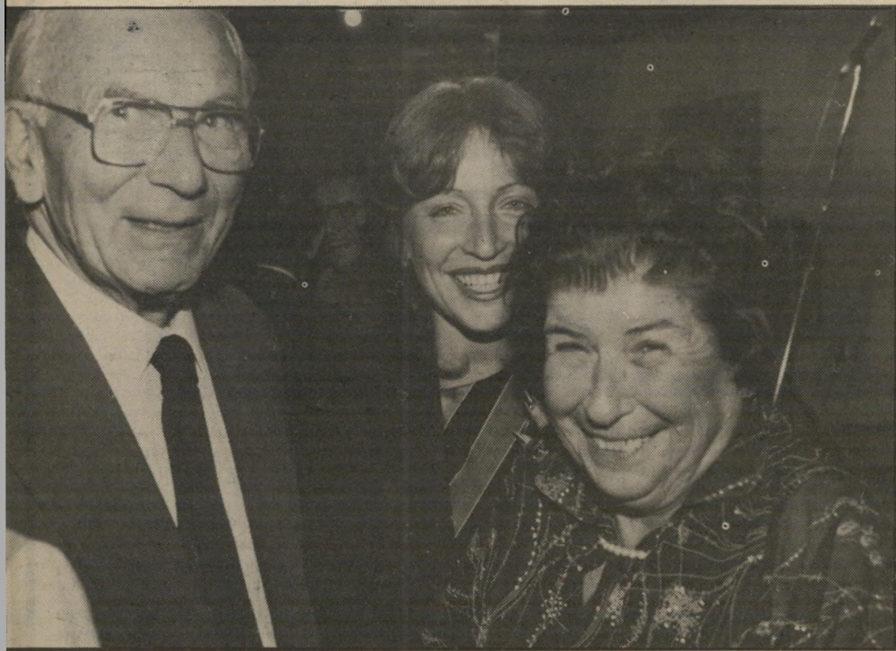
השופט כהן עם הנשיאה אבינור (באמצע: התובעת פנינה דבורין) אשה שלווה ומאוזנת."

למרות הביקורת על שיטת מינויי השופטים בארץ, הוא מציין כי עקרונות היא השיטה הטובה ביותר בעיניו. היא טובה מבחינה על-ידי העם במישרין, כמו כמכה מדינית בארצות-הברית. שם קורה שהמועמדים מפרסמים את עצמם לפעמים בעיתונים ועל גבי קופסאות גפרורים. שיטתנו עדיפה גם על וועדה המורכבת משופטים בלבד, שאז זה יוצר כת של שופטים. אפשר לריב על הרכב הוועדה שלנו, שיהיו יותר שופטים או פחות שר או חבר כנסת, אבל השיטה טובה. אין פגם אפילו בעניין הכסאות הנשמרים לזרמים ומפלגות שונות. בדרך הטבע נוצרות בוועדה